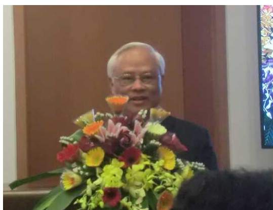
Hình ảnh Lễ khai trương